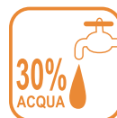
DILUIRE CON ACQUA