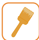
APPLICAZIONE A PENNELLO