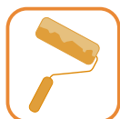
APPLICAZIONE A RULLO